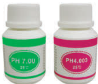
Produits étalons (PH 7 PH 4 Voire redox)