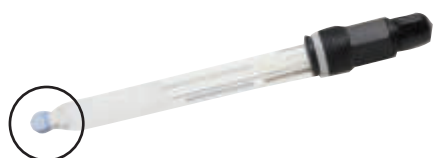
Sonde PH embout en verre