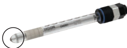
Sonde ORP embout métal